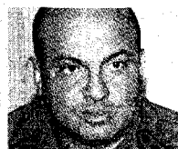
CLÍVER ALCAZAR GENERAL DE DIVISIÓN

Sus conexiones con el negocio de la droga ya habían sido señaladas por las autoridades estadounidenses. Debido también a sus vínculos con Hízbolá, el Departamento del Tesoro lo ha incluido en su lista de «control de activos»