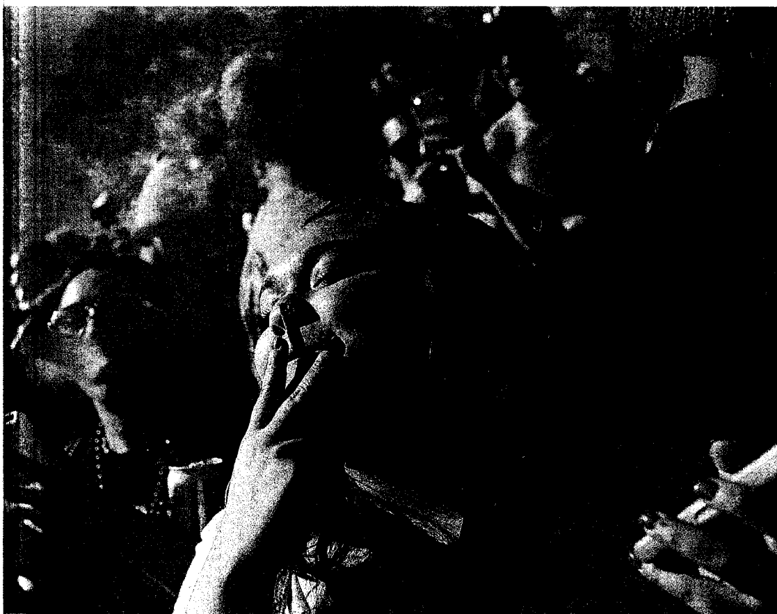
Jóvenes fuman marihuana en San Francisco. EE UU es el mayor consumidor del mundo.

Obama saca su mejor humor para los corresponsales