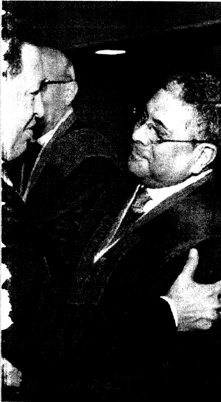
El juez Eladio Aponte, antes de su huida a EE.UU., junto a Chávez

Eladio Aponte Exjuez del Tribunal Superior de Venezuela