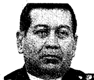
HENRY RANGEL MINISTRO DE DEFENSA

Uno de los posibles sucesores de Chávez, Cabello «es el jefe de todos ellos, el capo de los capos» del narcotráfico, porque «al final es quien controla toda la infraestructura del lavado de dinero», asegura Aponte