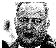
DIOSDADO CABELLO PRESIDENTE DE LA ASAMBLEA

Uno de los posibles sucesores de Chávez, Cabello «es el jefe de todos ellos, el capo de los capos» del narcotráfico, porque «al final es quien controla toda la infraestructura del lavado de dinero», asegura Aponte