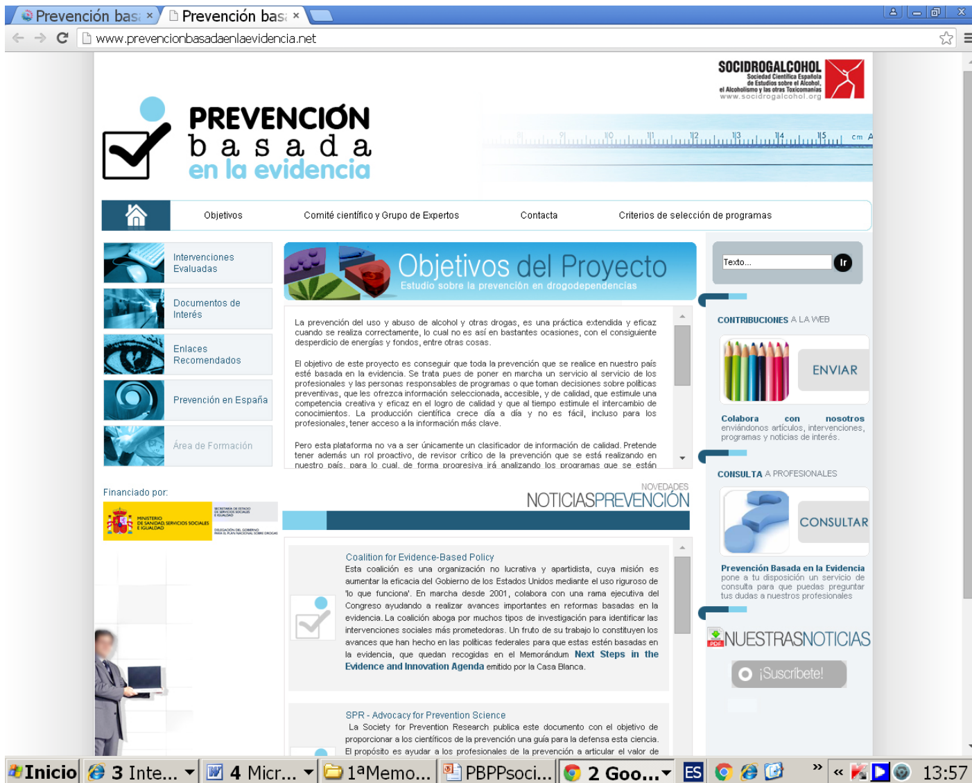
Portal de Buenas Prácticas en Reducción de La Demanda de Drogas